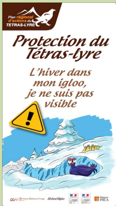
Bâche n° 1 « Igloo »