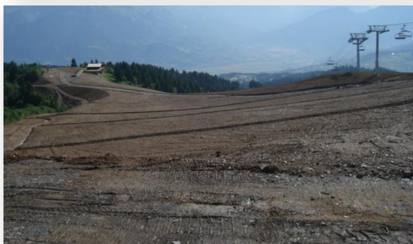
Figure 1 Autre cas : Terrassement à large ampleur qui aurait pu être amélioré en en préservant la transition entre la piste et la bordure et laissant quelques îlots de végétations

Débroussaillage en mosaïque Enherbement Bordure de piste non linéaire Renvoi d'eau Îlots de rhododendron maintenus